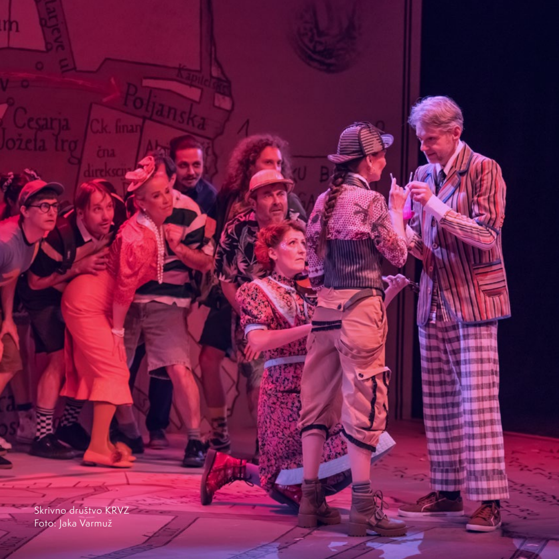
Skrivno društvo KRVZ