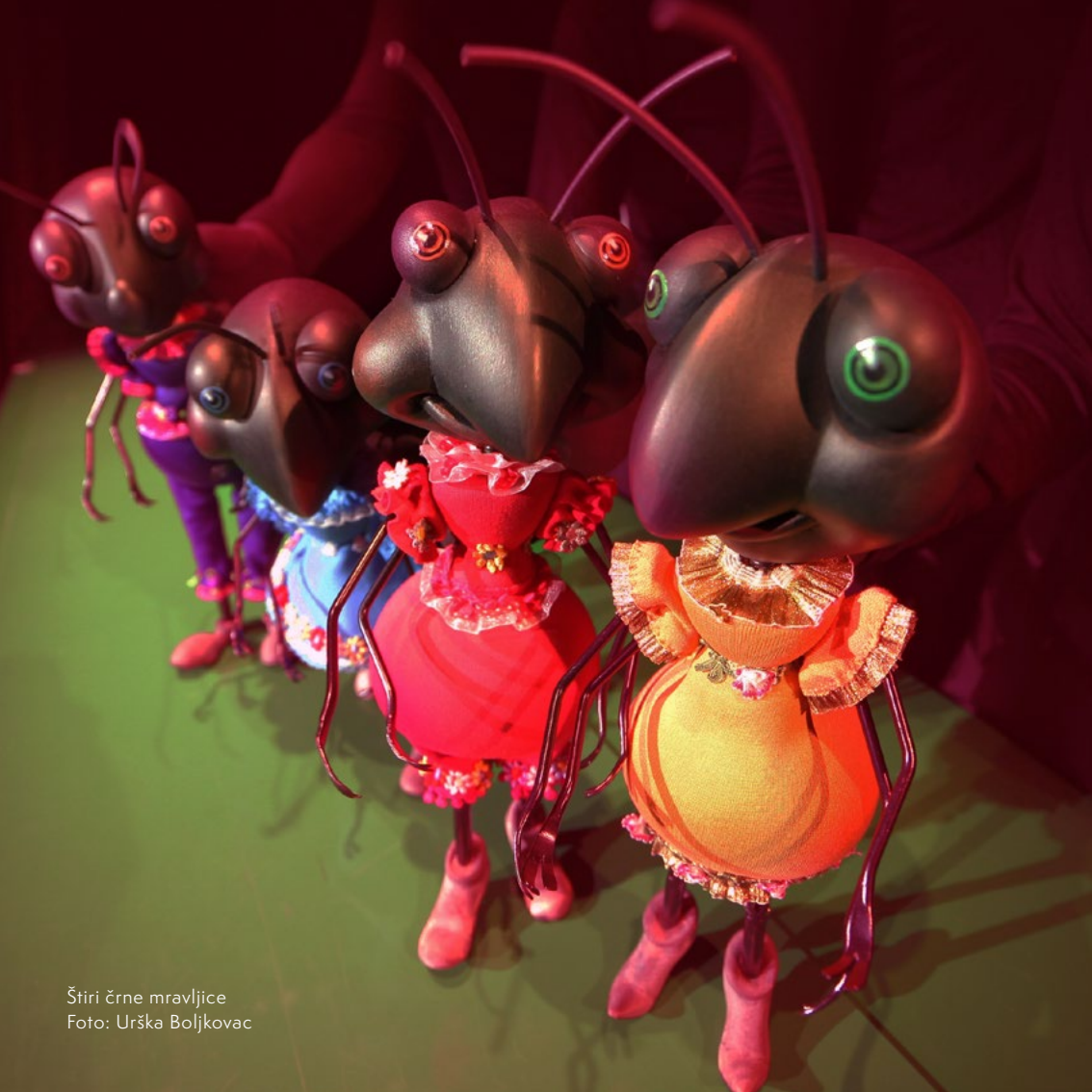
Štiri črne mravljice